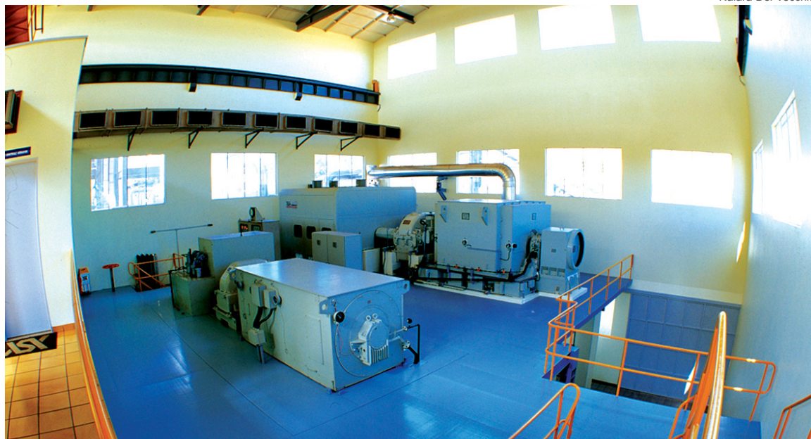
Dados estimam que a bioeletricidade da cana possa representar até 50% da geração anual no estado.

No país, o sistema conta com a linha de financiamento oferecida pelo Banco Nacional de Desenvolvimento Econômico e Social - BNDES para implantação. Entre as vantagens desta energia sustentável estão a confiabilidade, baixo custo, abastecimento contínuo, ausência de desperdício e redução no impacto ambiental.