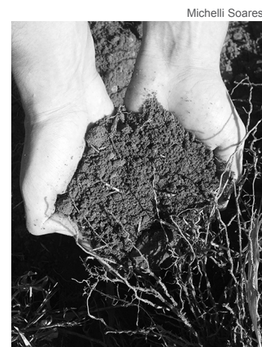
Novidade divide opiniões

Apesar de o resultado ser positivo, ainda há desvantagens: os custos são discutidos por serem elevados, mais que o dos fertilizantes químicos encontrados no mercado. Já para as pequenas culturas, o uso do fertilizante orgânico apresenta um melhor custo-benefício e fica a critério do produtor testar e analisar o produto.