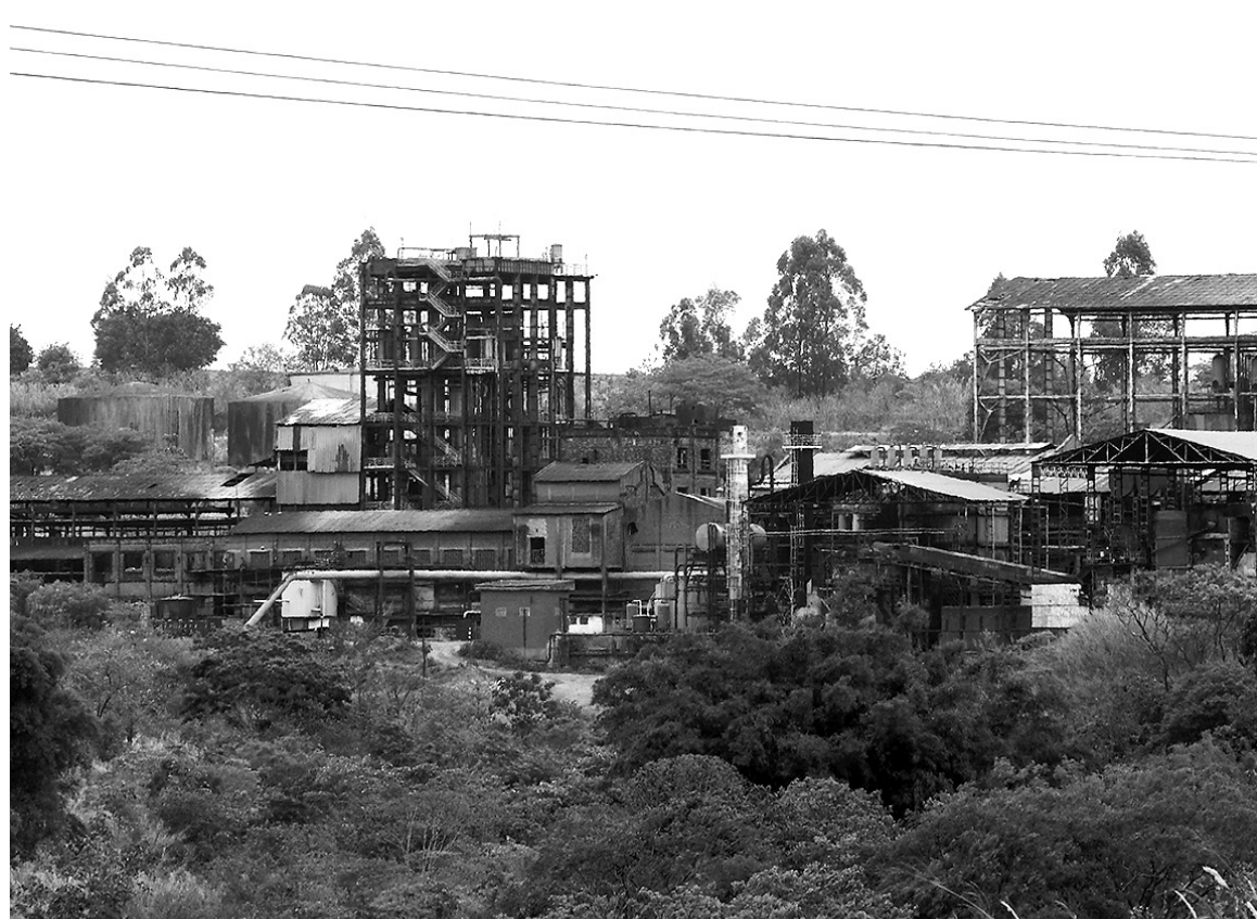
Usina Maringá, em Araraquara, enfrenta dificuldades para pagar salários e rescisões trabalhistas

Dados da União da Indústria de Cana de Açúcar (Única) apontam que somente a região de Ribeirão Preto foi responsável, nos últimos quatro anos, pelo fechamento de cinco usinas. Em Araraquara, a Maringá é uma das usinas que enfrentam a crise. Recentemente o Ministério Público do Trabalho bloqueou todos os bens da indústria como forma de garantir o pagamento dos direitos dos funcionários que foram demitidos. Segundo a MBF Agribusiness – Assessoria, Gestão e Monitoramento, o setor possui uma dívida de R$ 60 bilhões. Das 67 usinas que estão em processo de recuperação judicial, 83% têm dívidas que supe-