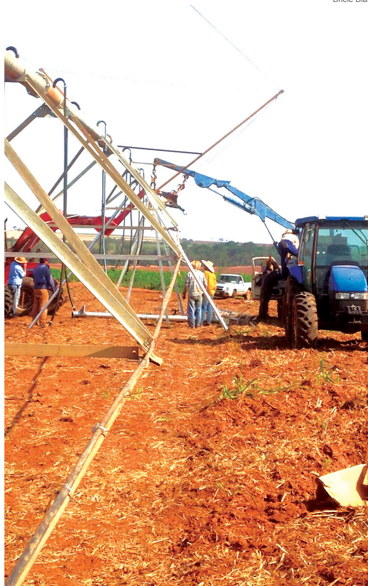
Pivô já instalado para iniciar o plantio de cebola. Em aproximadamente três meses já haverá colheita

De acordo com o site www.investe.sp.gov , mantido pelo governo do estado, São Paulo é responsável por cerca de 60% da produção de cana do Brasil; 54% da área ocupada por essa cultura se localiza no território paulista. Dentre os produtos da cana, o açúcar ficou com 69% da produção, deixando o etanol para trás com 30%. O quadro tende a mudar nos próximos anos, já que o foco atual é a produção de combustível.