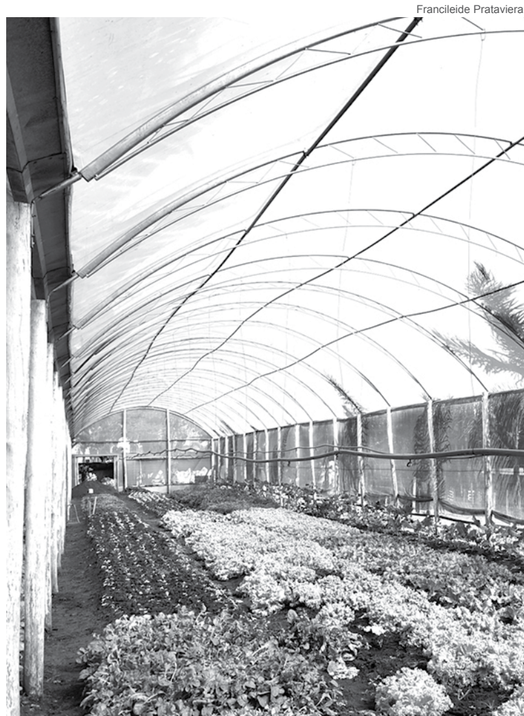
Na estufa municipal de Ibaté são produzidas diversas variedades de verduras para consumo nas escolas e hospital que abastecem redes públicas

Junior ainda ressalta a qualidade e a excelente procedência dos legumes produzidos, considerados alimentos frescos e saudáveis. “Nós acompanhamos a produção diariamente e sabemos com toda certeza que é utilizado o mínimo possível de produtos químicos. São verduras quase orgânicas, colhidas de madrugada e distribuídas para a