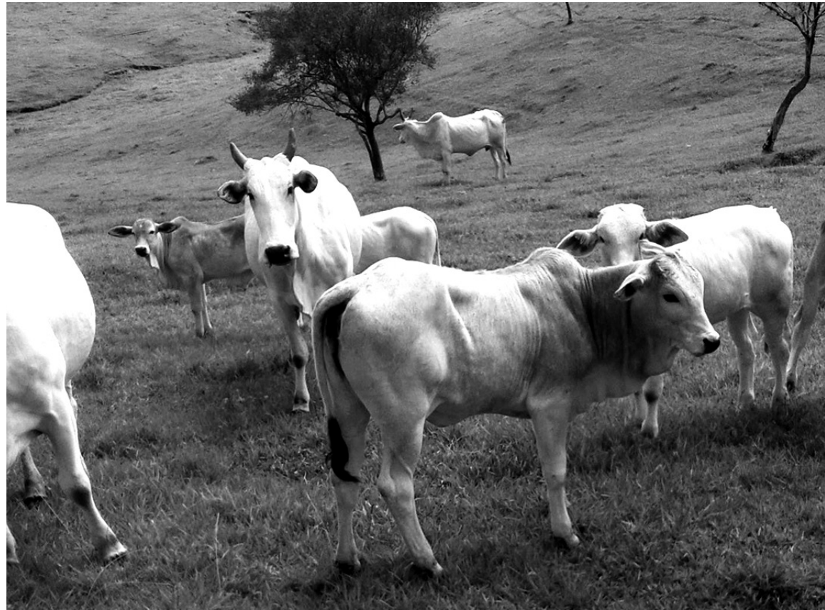
Em 2011, trabalho rendeu o Prêmio Dr. Hélio Coelho de Mérito em Pesquisa para USP de São Carlos