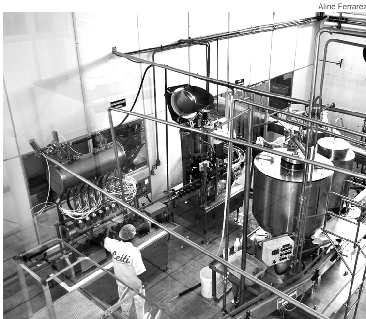
Produção de leite tipo A deve ser feita em fazenda

A produção conta com ordenha mecanizada e o leite passa por um sistema de canalização subterrânea, vai para um tanque de estocagem refrigerado e depois para o laticínio, para a pasteurização. O rebanho conta com 13 mil animais e é o maior do país. Além disso, até a embalagem das garrafas de leite, que é certificada pela Anvisa, tem efeito bactericida.