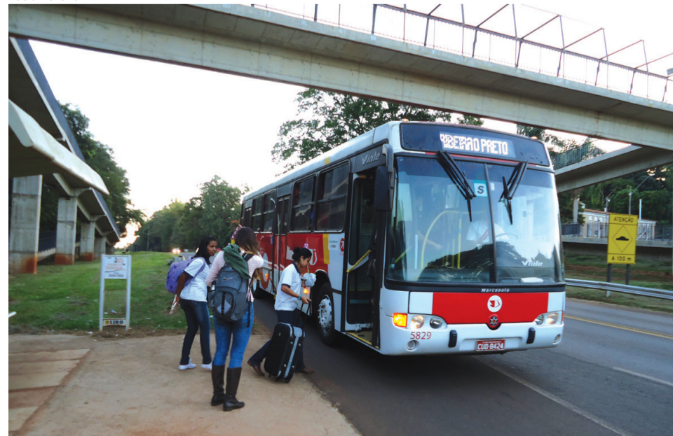
Saída de estudantes prejudica economia da cidade