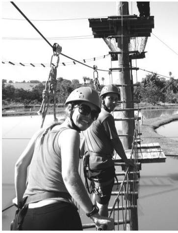
Brotas oferece boas opções