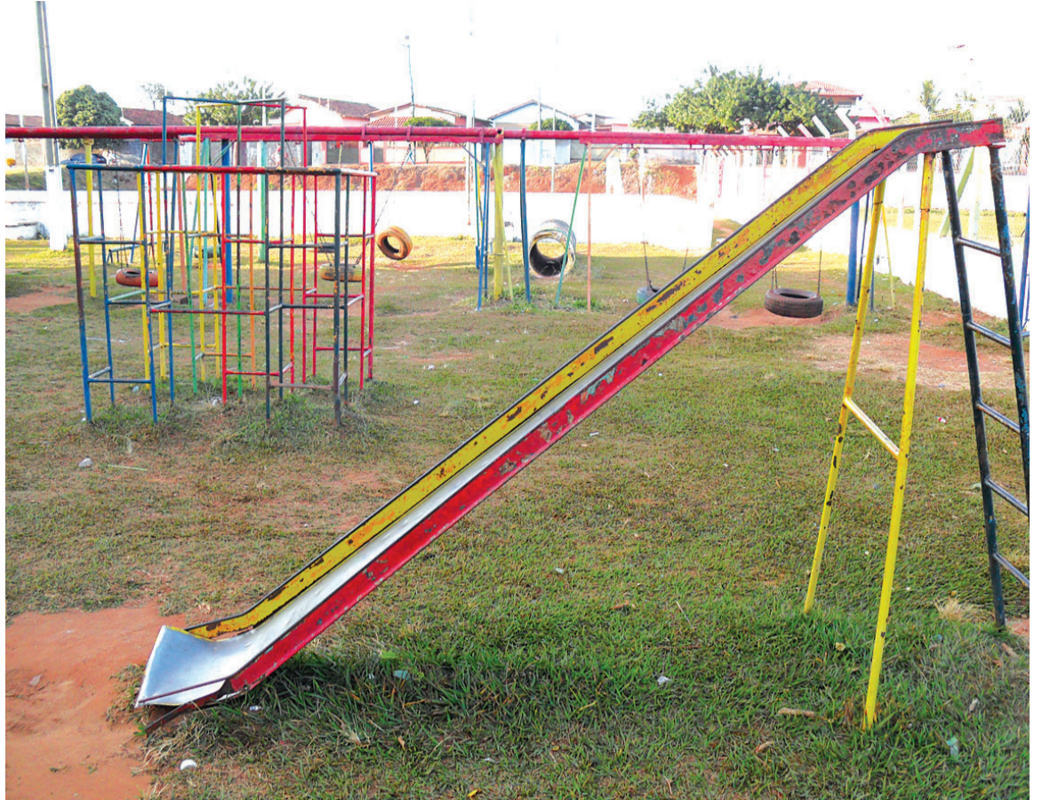
Tradicionais parquinhos de diversão, muitos abandonados, quase não despertam interesse das crianças

Preocupada com os hábitos de recreação e tentando manter vivas as brincadeiras ao ar livre, ela desenvolve um trabalho que