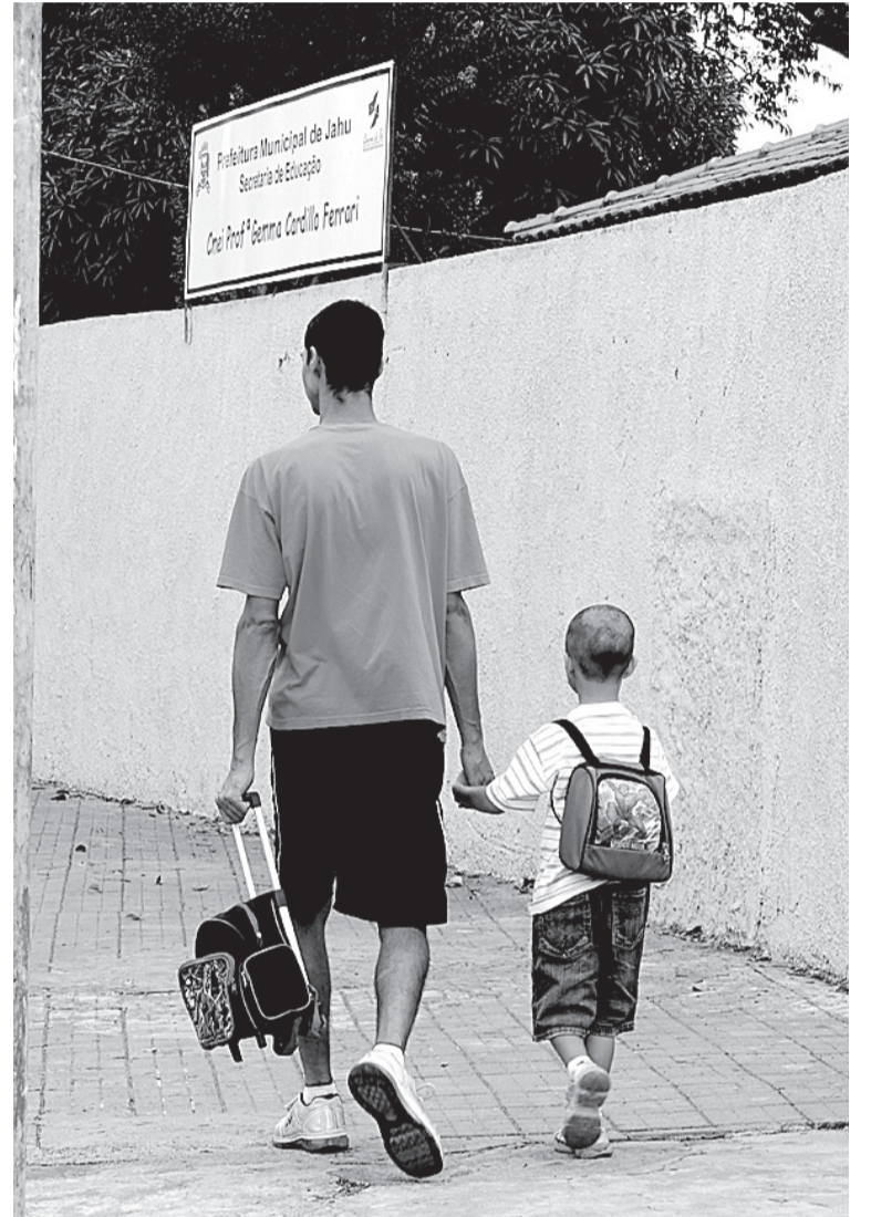
Incerteza: apesar de nenhuma creche ter divulgado férias, os pais já estão preocupados

Apesar de nenhuma creche do município de Jaú ter divulgado férias, os pais já estão preocupados com a possível mudança. Como é o caso de