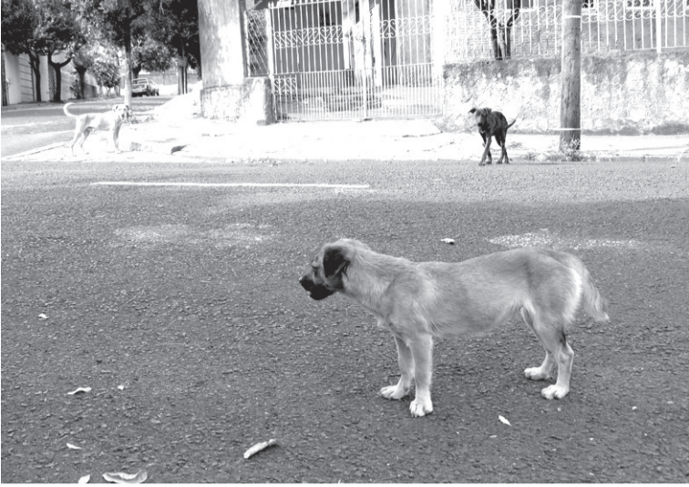
Cena comum em Araraquara: animais abandonados circulam pelas ruas e atrapalham o trânsito