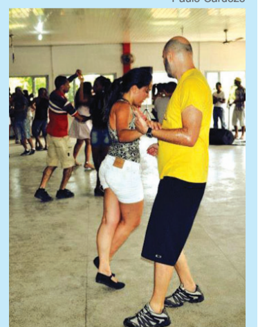
Forró movimenta Itaunas(BA)

Para ele, desfrutar desse tipo de aventura representa um grande crescimento pessoal. “Só não se apaixona por uma aventura quem não a experimenta”. Mori alerta os aventureiros que é possível achar a cara-metade nos eventos. “Conheci minha parceira em no festival e desde outubro estamos casados”.