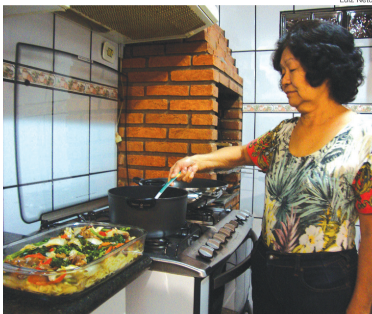
Voluntária fazendo yakisoba, prato servido na Festa do Quitute

Ainda segundo a diretoria, por não ser uma entidade filantrópica, o dinheiro arrecadado