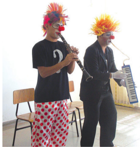
A música faz parte das performances apresentadas pelo grupo nas praças da periferia da cidade

O grupo, que nasceu em uma região afastada do centro da cidade, existe há mais de dois anos e conta com onze dedicados integrantes. Tendo como objetivo valorizar a importância do voluntariado em todas as comunidades, a iniciativa já vem colhendo bons resultados