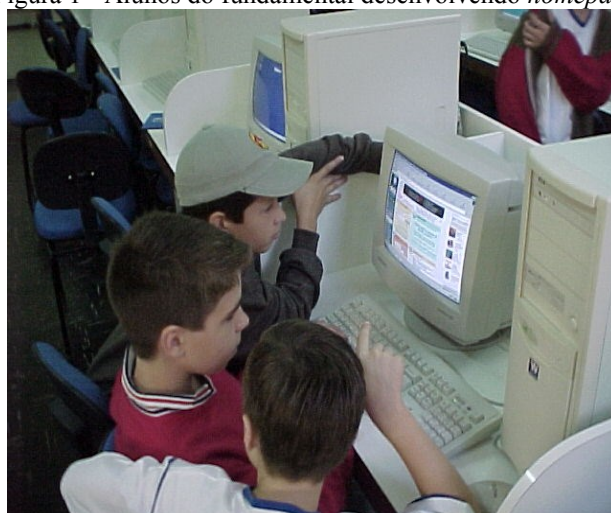
Figura 1 - Alunos do fundamental desenvolvendo homepages

Times New Roman, Tamanho 10, Alinhado próximo à Figura. Espaçamento simples.